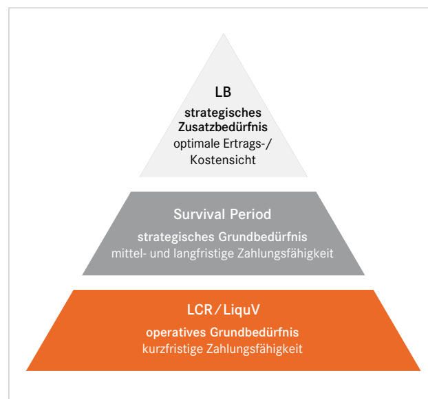
Abbildung 2: Bedürfnispyramide des Liquiditätsmanagements

Um eine Priorisierung vornehmen zu können, wurden diese Merkmale in eine Art Bedürfnispyramide transformiert: