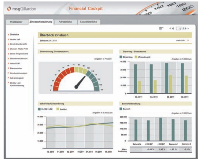
Abbildung 2: Beispielansicht – Überblick Zinsbuchsteuerung